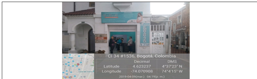
Fotografía No. 1. Elemento de publicidad exterior visual tipo AVISO EN FACHADA sin registro ante la Secretaría Distrital de Ambiente y otros elementos instalados tipo pendón y aviso adicional en fachada. Foto del 09-04-2019