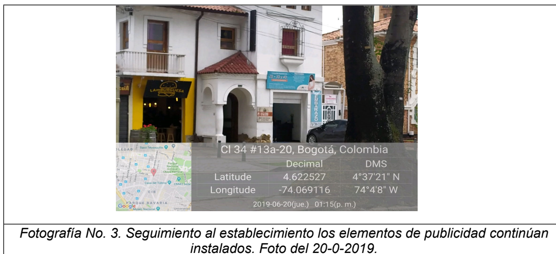
Fotografía No. 3. Seguimiento al establecimiento los elementos de publicidad continúan instalados. Foto del 20-0-2019.